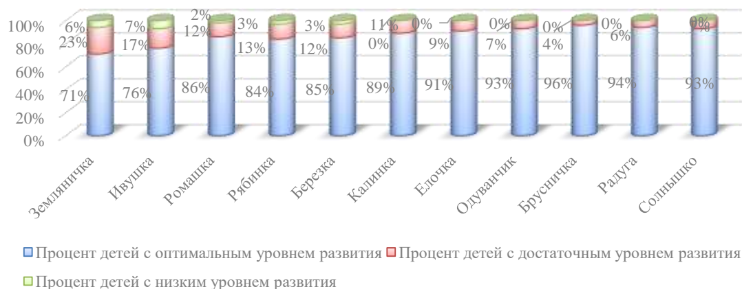
Сводная диаграмма индивидуального учета уровней развития воспитанников по возрастным группам, 2020-2021 г

Анализ результатов позволил оценить эффективность ООП ДО, организацию образовательной деятельности в группе, ДОУ, сделать качественный и количественный анализ развития конкретного ребенка и определить общегрупповую тенденцию развития детей в каждой возрастной группе. Результаты мониторинга представлены в таблицах ниже.